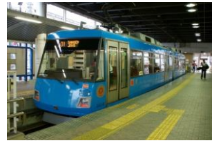
世田谷線・下高井戸駅